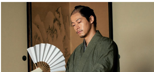
SEPPUKU : L'HONNEUR D'UN SAMOURAÏ