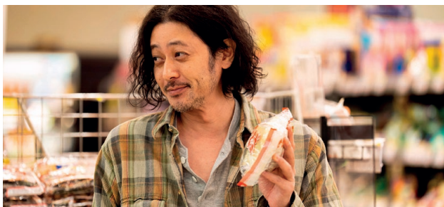
MON GRAND FRÈRE ET MOI