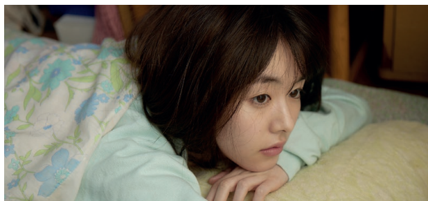
LA FILLE DU KONBINI