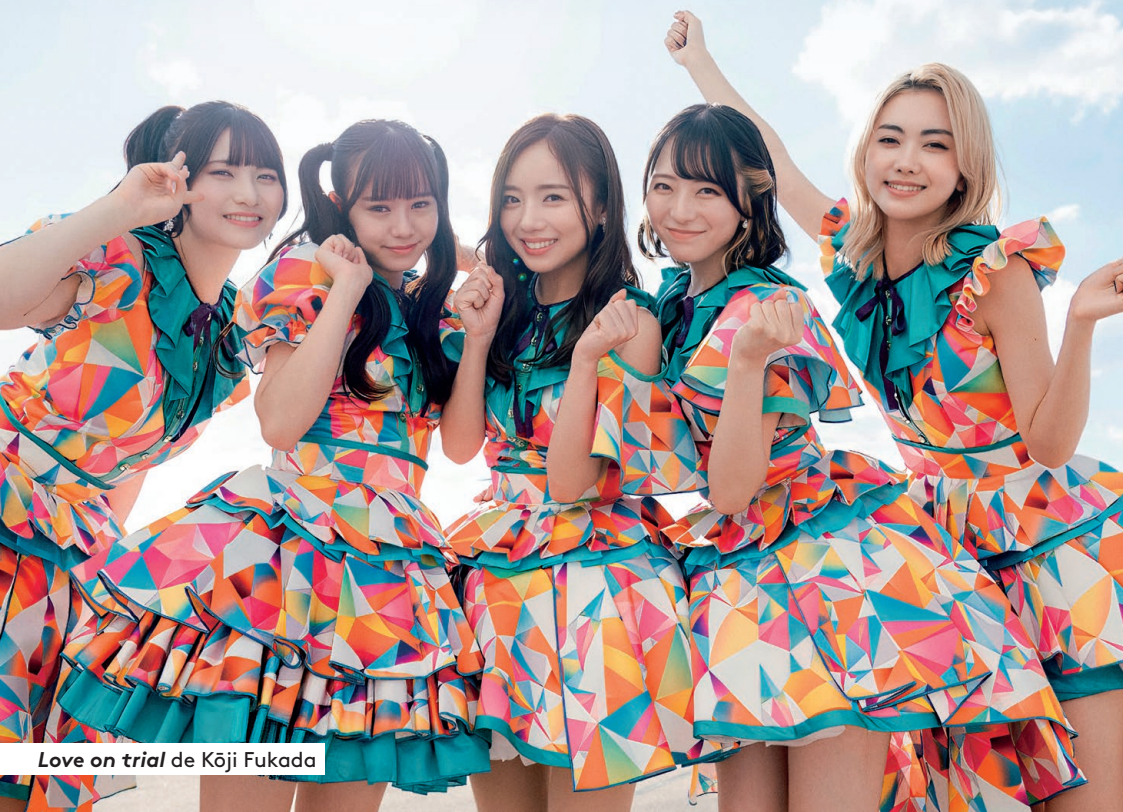
Love on trial de Kōji Fukada