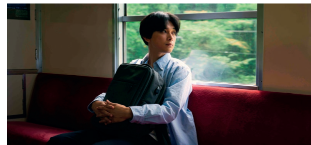
FAIS-MOI UN SIGNE